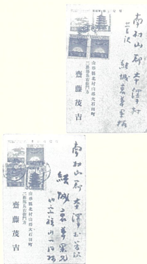
和昭付 上 5月 7日 昭和 22年 5月 4日 茂吉 宛付 葉書 宛下 宛年 宛本 宛誌 1頁 参考 齋藤 茂吉 葉書 22年 5月 4日 茂吉 宛付 葉書 宛下 宛年 宛本 宛誌 1頁 参考 齋藤 茂吉 葉書